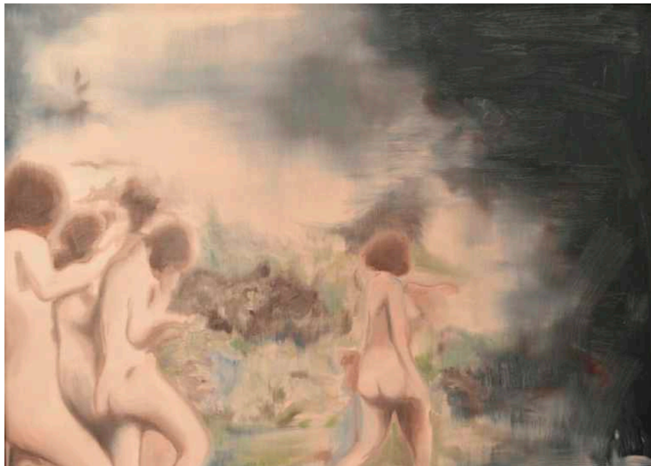
Sin título. Serie El Satarío. Óleo sobre papel marufado. 50 x 70 cm. Año 2018.