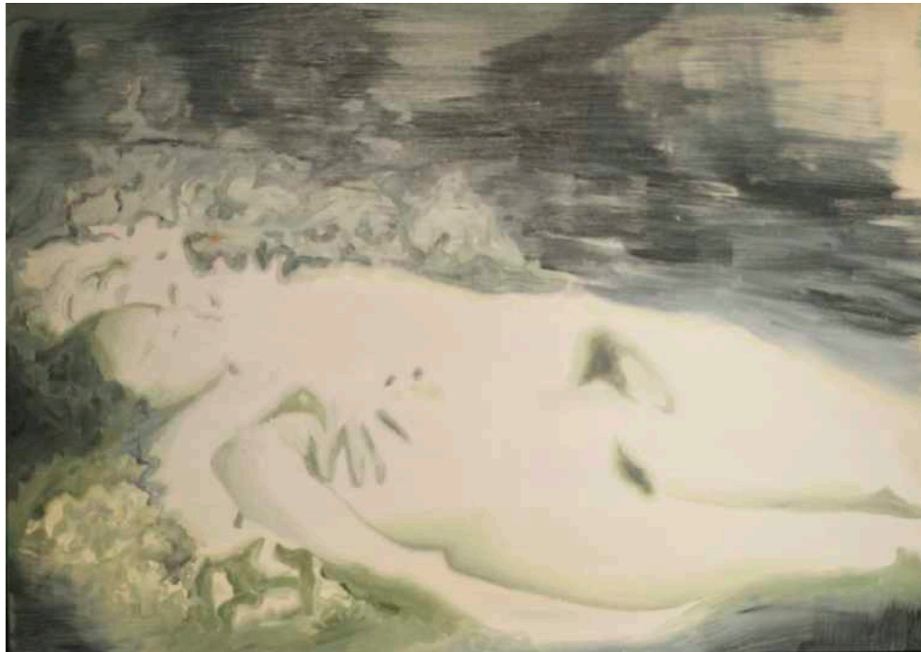
Sin título. Serie El Satarío . Óleo sobre papel marufiado. 50 x 70 cm. Año 2018.