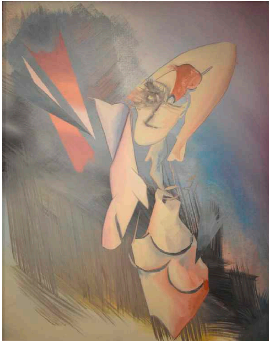
Sin título Óleo sobre papel marufado. 52 x 41,5 cm. Año 2018.