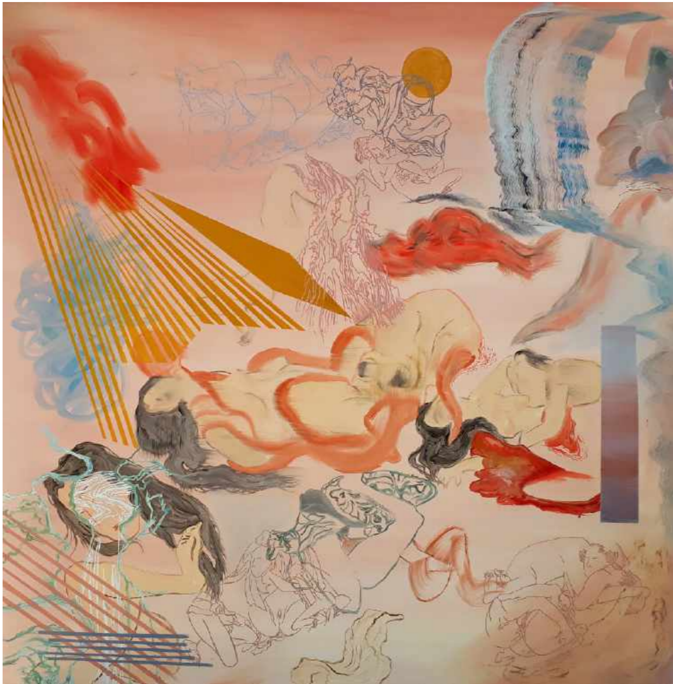
Estudio sobre Shunga. Óleo sobre tela. 105 x 105 cm. Año 2018.