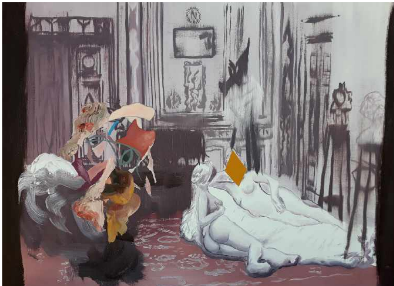
Living. Óleo sobre papel marufado. 50 x 70 cm. Año 2018.