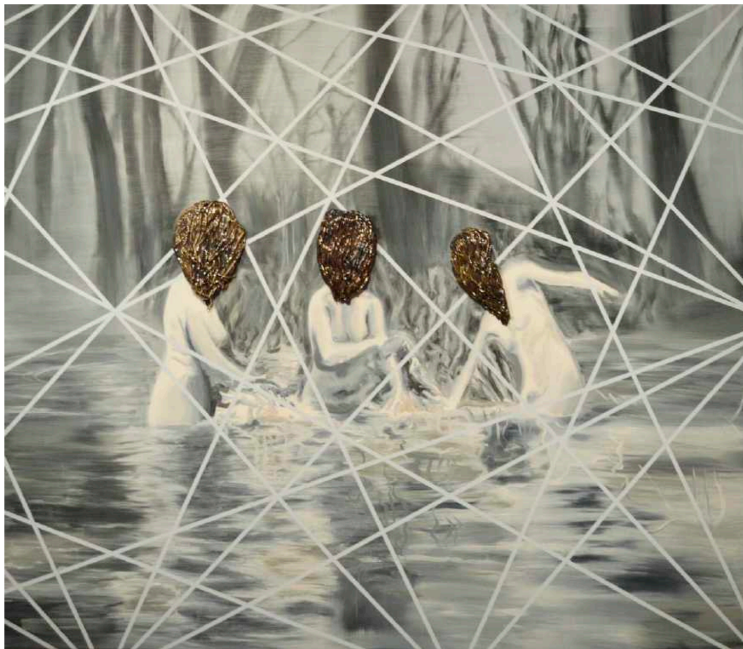
Las bañistas. Óleo y cerámica sobre tela. 97 x 112 cm. Año 2018.