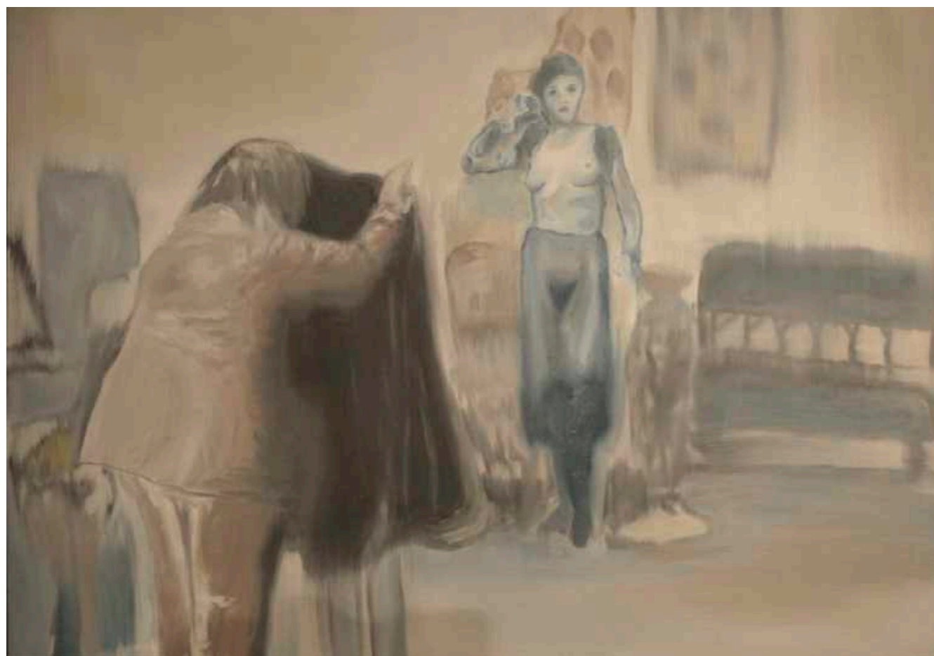
Estudio del fotógrafo. Óleo sobre papel maruflado. 50 x 70 cm. Año 2018.