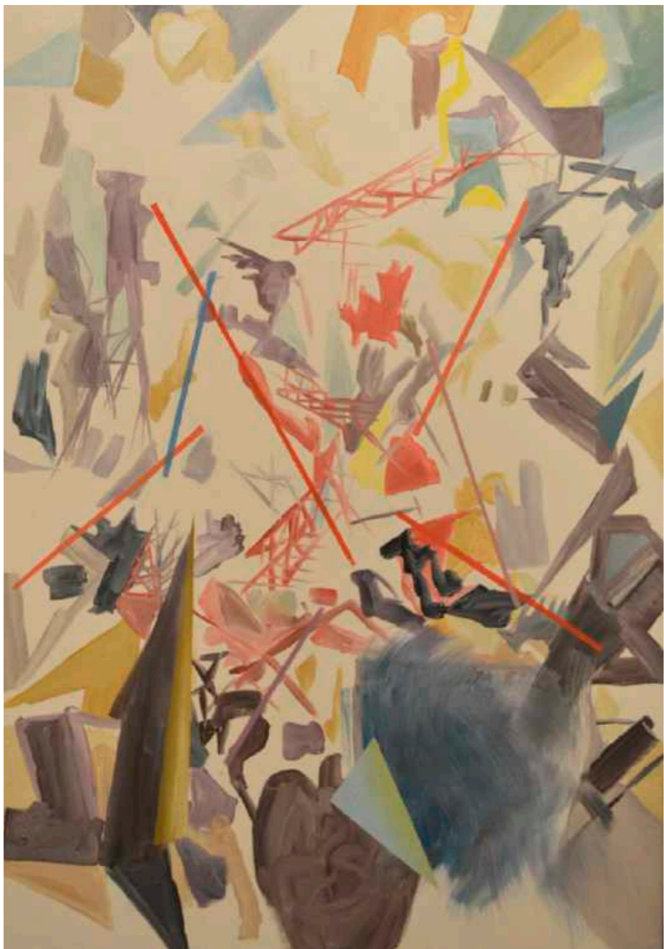
Paris. Óleo sobre papel marufado. 70 x 50 cm. Año 2018.