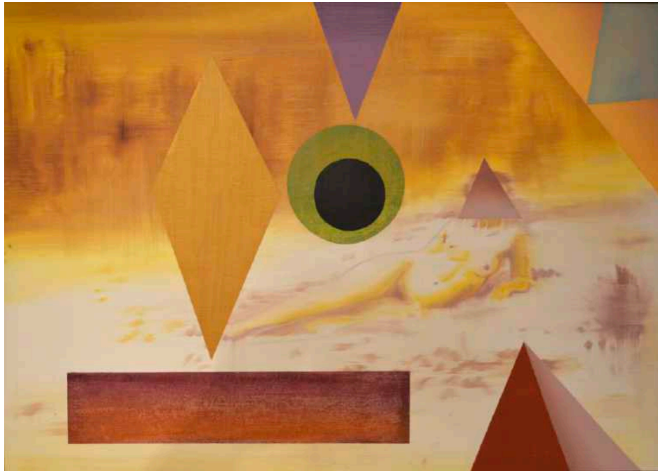
Paisaje metafísico. Óleo sobre papel marfileado. 50 x 70 cm. Año 2018.