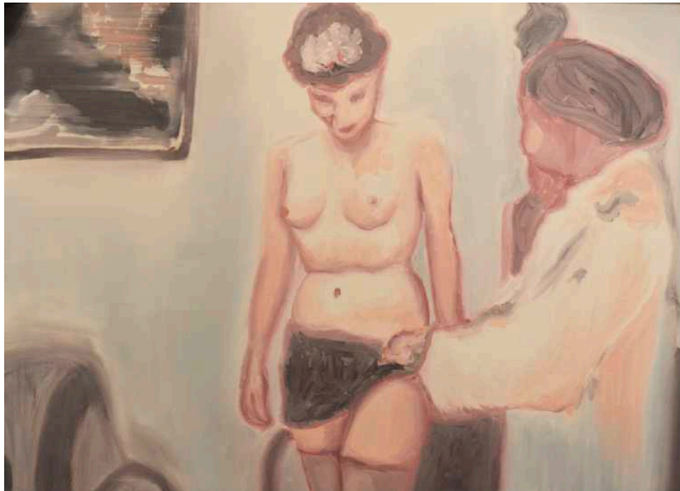
Estudio del pintor. Óleo sobre papel maruflado. 50 x 70 cm. Año 2018.