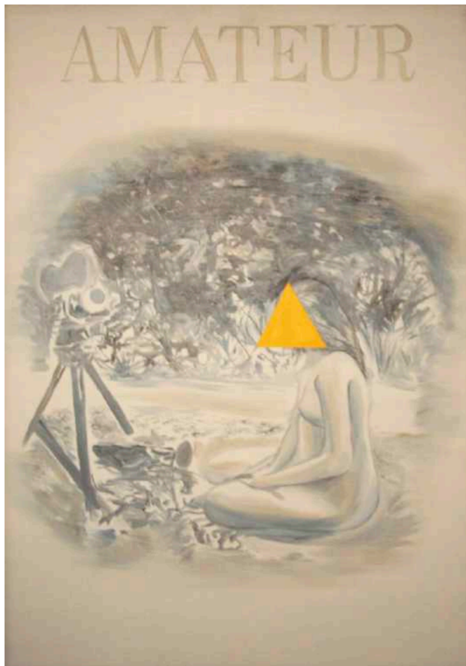
Amateur. Óleo sobre papel marufado. 70 x 50 cm. Año 2018.