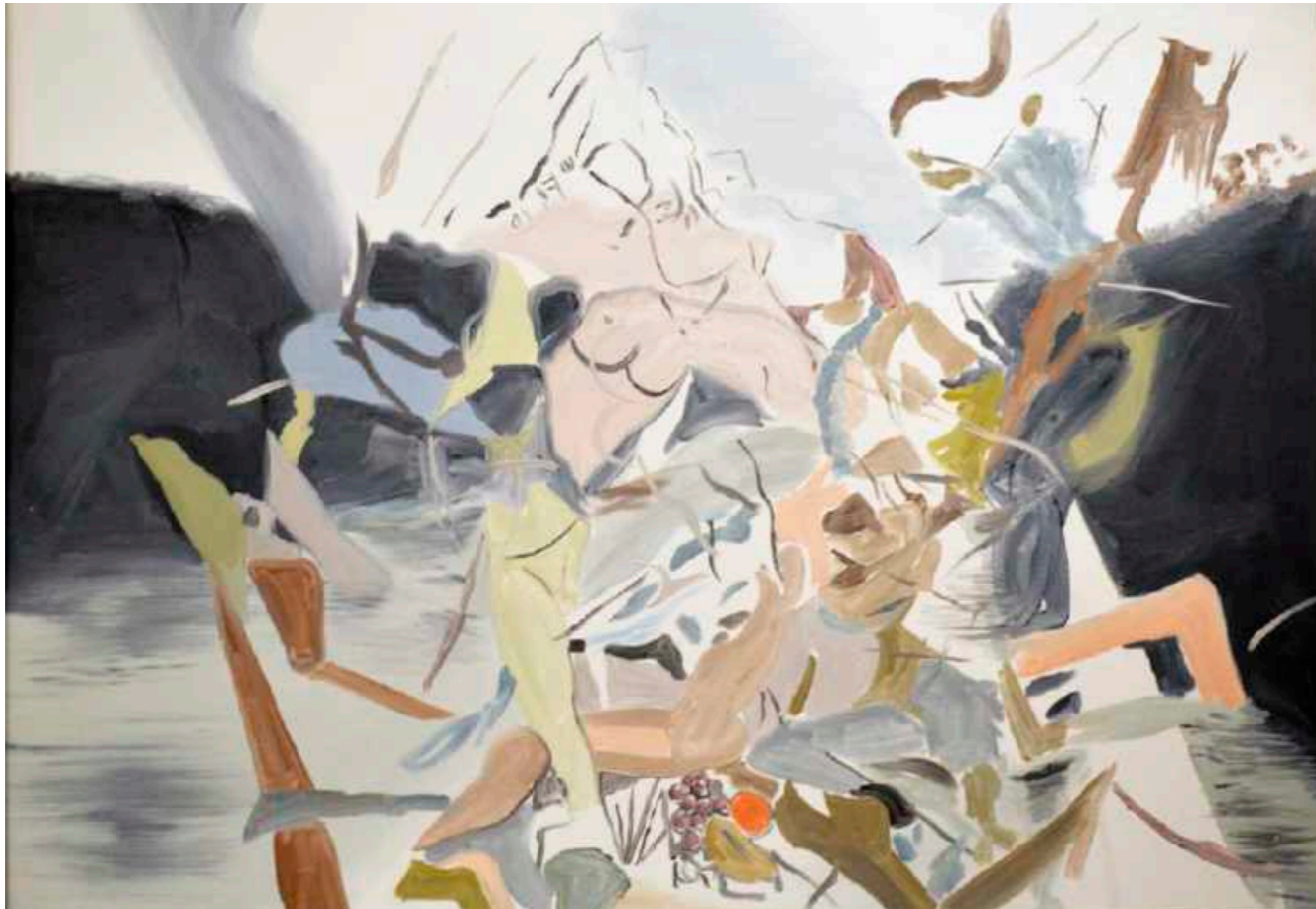
Sin título. Óleo sobre papel marfiado. 50 x 70 cm. Año 2018.