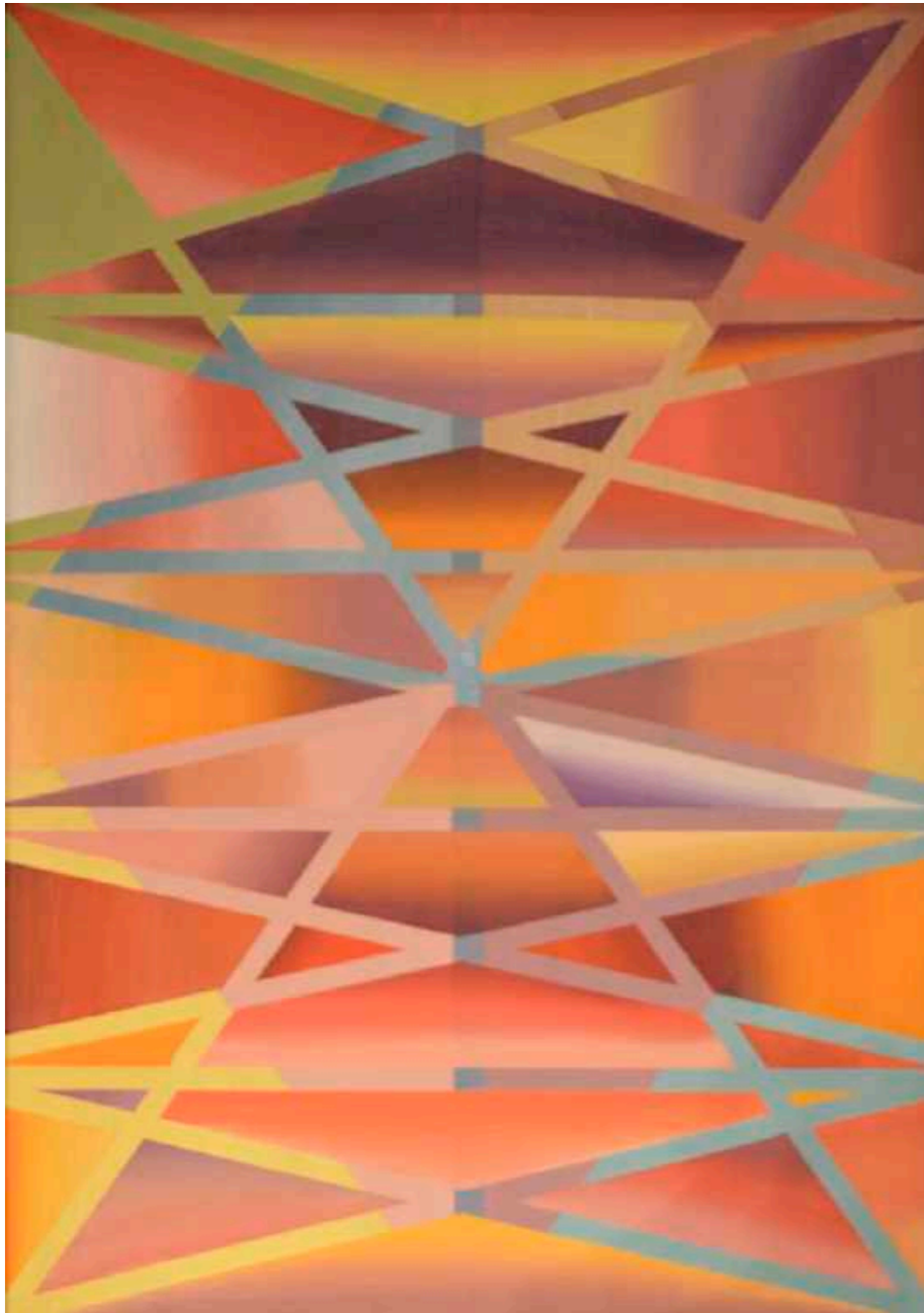
Geometría II. Óleo sobre papel marullado. 70 x 50 cm. Año 2018.