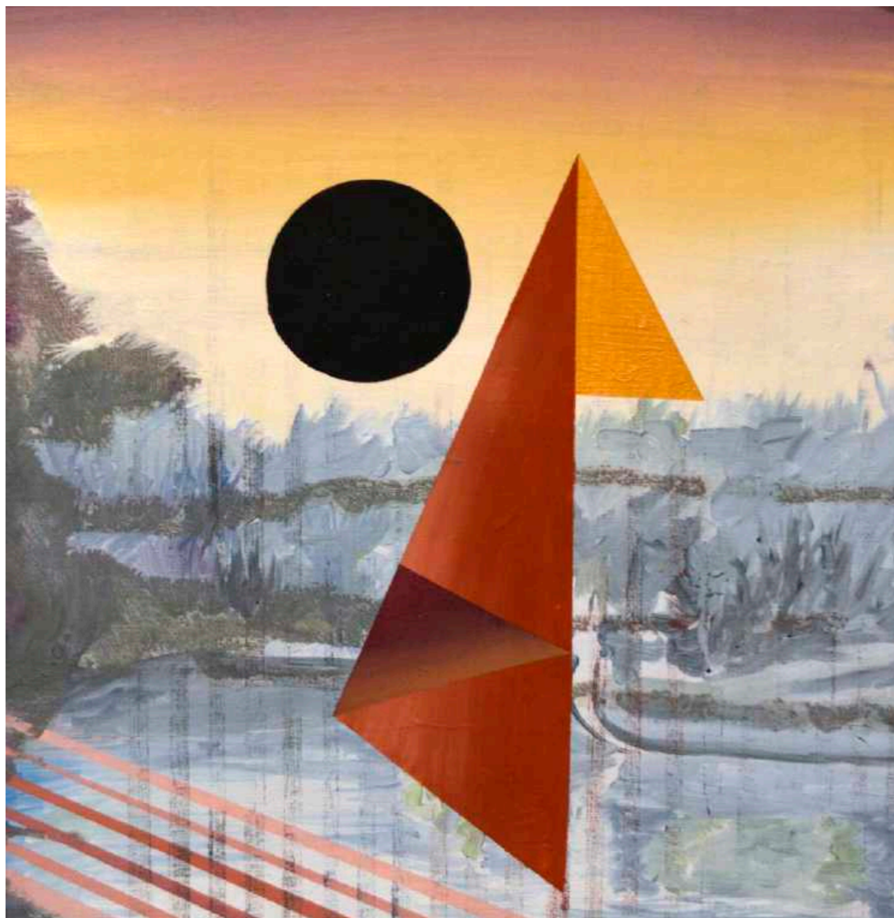
Paisaje geometría. Óleo sobre papel maruflado. 35 x 35 cm. Año 2018.